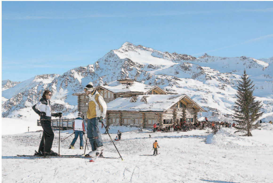
PANORAMI BIANCHI Le piste di Santa Caterina Valfurva, dove sciava e si allenava Deborah Compagnoni

L'offerta Bormio Pass Sci & Terme permette di acquistare tessere con più offerte, dalla silver alla diamond, comprensive di skipass e ingresso alle terme (costano a partire da 128 euro per quattro servizi, con agevolazioni per i bambini fino a 8 e 16 anni). Se invece cercate soggiorni romantici all'insegna del campanilismo sportivo, il Romantik Hotel Baita Fiorita a Santa Caterina Valfurva ( www.romantikhotels.com/S-Caterina-Valfurva ) propone un pacchetto promozionale di una settimana con trattamento di mezza pensione a partire da 560 euro a persona. Cos'ha di speciale a parte l'atmosfera d'antan? Si trova a 30 metri dalla seggiovia Paradiso che porta alle piste dei Campionati del Mondo. Ed è l'hotel della famiglia di Deborah Compagnoni. Per altre informazioni: www.valtellina.it